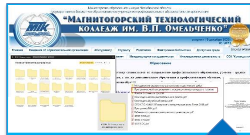
Формирование ОП СПО на сайте колледжа