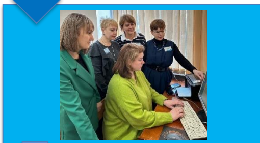
Работа ЦК над формированием и сбором комплекта программ УП и ПП