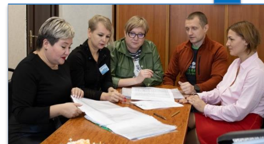
Согласование и подписание комплекта программ у работодателей